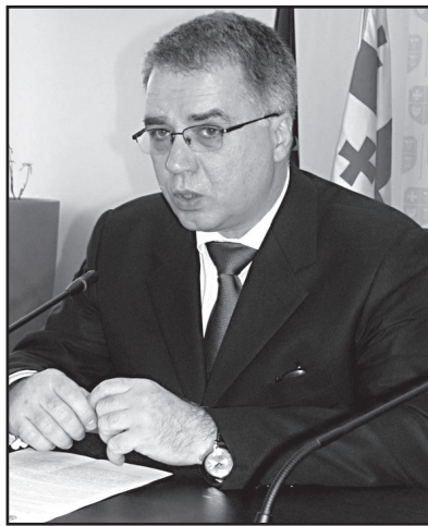
ფიკაცია და დედებისა და ბავშვების ვიტამინებითა და მიკროელემენტებით უზრუნველყოფა. ექსპერტული გათვლებით, აღნიშნული ინტერვენციები 25 პროცენტით შეამცირებს 10 წლის მანძილზე კვების დეფიციტთან დაკავშირებულ 1,3 მილიარდი აშშ დოლარის ზარალს საქართველოში. რაც ყველაზე მნიშვნელოვანია, თითქმის 1000 ბავშვს შეუნარჩუნდება სიცოცხლე ამავე პერიოდის განმავლობაში.

გაეროს ექსპერტები სისტემის ხარვეზად აღიარებენ დედათა და ბავშვთა ჯანდაცვის არსებითი მომსახურების ფრაგმენტაციას - არ ხდება სამშობიარო კლინიკიდან განვლილი ახალშობილის დროული მართვა ამბულატორიაში და შესაბამისი მომსახურების მიმწოდებლები არ იღებენ პასუხისმგებლობას, გააკონტროლონ ჩვილის ჯანმრთელობის მდგომარეობა და ინფორმაცია მიანოდონ მშობლებს ბავშვის მოვლის სათანადო პრაქტიკის, მათ შორის სრულფასოვანი კვების, შესახებ. ჯანდაცვის სისტემის ამგვარი ხარვეზები არ აძლევს გოგითა და მის მსგავს ბავშვებს საშუალებას, ისარგებლონ უწყვეტი მომსახურებით და მიიღონ საჭირო დახმარება სიცოცხლის განმავლობაში.