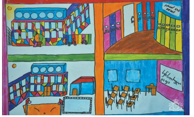
კომპანია „ესაბის“, ასეთი შესანიშნავი პრიზებით რომ დაგვასაჩუქრა. ჩემს ნახატში ძალიან დიდი შრომა ჩავდე და, რა თქმა უნდა, გამიხარდა, რომ გავიმარჯვე. დანარჩენ ორ გამარჯვებულსაც მივულოცავ ამ წარმატებას“.