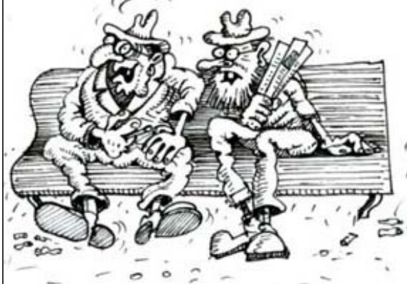
მე დაყრდნობილი ვიყავი პენსიონერმა, — განა არ ავიხებოდი...