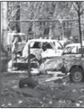
გზაში დაზარალებული ავტომობილი