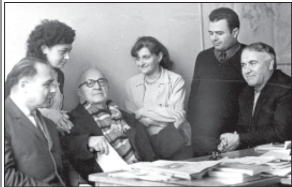
ბაზში „სახალხო განათლების“ რედაქციის სასურველი სტუმარი ხშირად იყო სახელგანთქმული ქართველი ენათმეცნიერი, აკადემიკოსი გიორგი ახვლედიანი (ცენტრში).