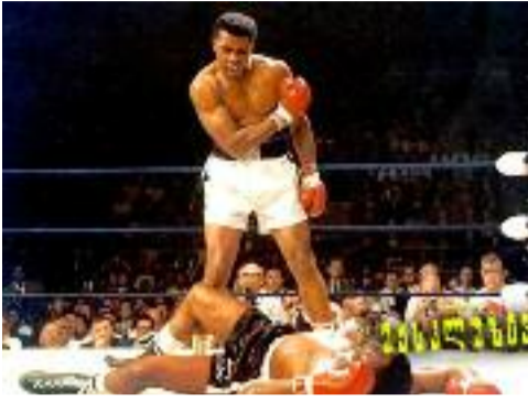
(გაგრძელება წინა ნომრიდან)

ღმერთმა მოაპოთხა თამის განუმეორებელ ჩემპიონს, მშვიდობით, მუჰამედ ალი!