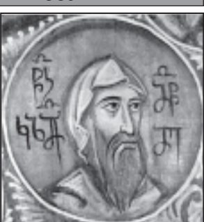
წმიდა კოზმანს დაუწერია „მესხ-მა ქვეყანა დელოფისა“, რომელსაც ჩვენამდე არ მოუღწევია.

ღმრსი დავით გარეჯელის მიერ დაარსებული სამონასტრო კომპლექსი საუკუნეების მანძილზე იყო სრულად საქართველოს სულთღი და კულტურული ცხოვრების ცენტრი. სხვადასხვა დროს აქ მოღვაწეობდნენ ღირსი დლო გარეჯელი და ღმრის ლუკანე, წმიდა დამიანე ღმერთყფილი („შენ ხარ ვენახის“ მთქმელი), ღმრის ილარიონ ქართველი, ღმრის იოანე ჭყონდიდელი, წმიდა სეგმეონი.