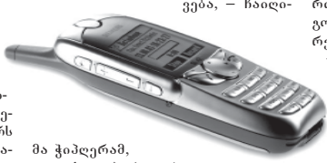
მა ჰქვია ლაზარე...