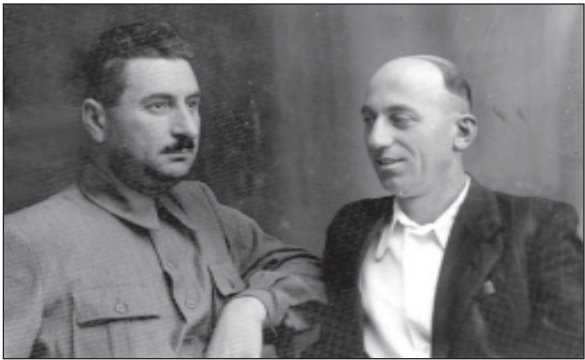
საქართველოს სახალხო არტისტი ილია რაიძე (მარჯვნივ) და მისი მეგობარი კოლა კობახიძე. 1951 წელი.