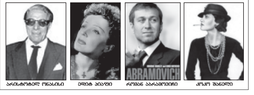
არისტოტელ მანასი ელიტ პიავი რომან არამოვიჩი კოკო შანელი