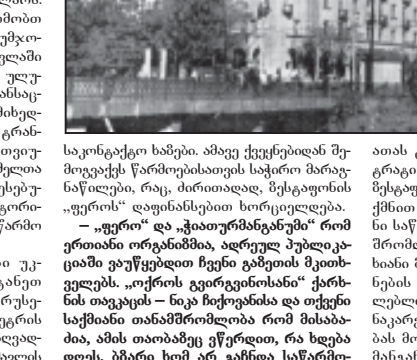
ჭიათურის რაიონში მშენებლობის სამუშაოები