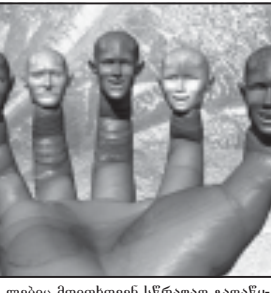
მრჩეველთა საბჭოს წევრები