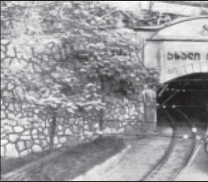
ჭიათურის რაიონში მშენებლობის სამუშაოები