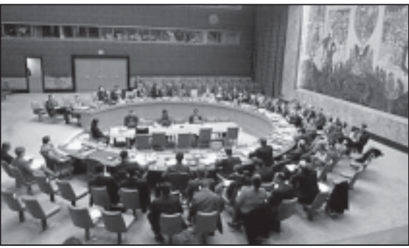
აფრიკის კავშირის ქვეყნებმა მიაღწიეს მორიგეობას იმის თაობაზე, რომ მოითხოვენ უშიშროების საზოგადოებრივი უფლებების აღდგენას.