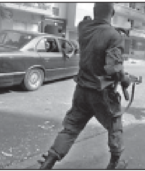
ხუნტის მეთაურია პრემიერ-მინისტრი სილივანო ბურნარდ.

ხუნტის მეთაურია პრემიერ-მინისტრი სილივანო ბურნარდ. ხუნტის მეთაურია პრემიერ-მინისტრი სილივანო ბურნარდ.