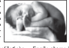
როგორც ყველა ლიცენზირებული სამშობიარო სახლი, ჩვენი ცენტრიც მონაწილე პროგრამის „გარანტი დეკლარაციის საშუალებით“.

ბუნებრივი, დიდი აგვისტოს პირველი სამი დღის მონაცემები გვიჩვენებს მსკვირიანი მედიცინის ცენტრიდან და თბილისის დაბით ქორიძის სახელობის მე-4 სამშობიარო სახლიდან.