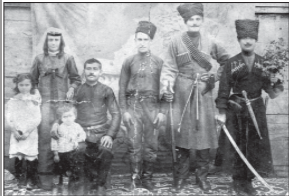
შპარქის რაიონი. სოფელი სახენისი. თავადგრიძეების ოჯახი. გასული საუკუნის 10-იანი წლები.