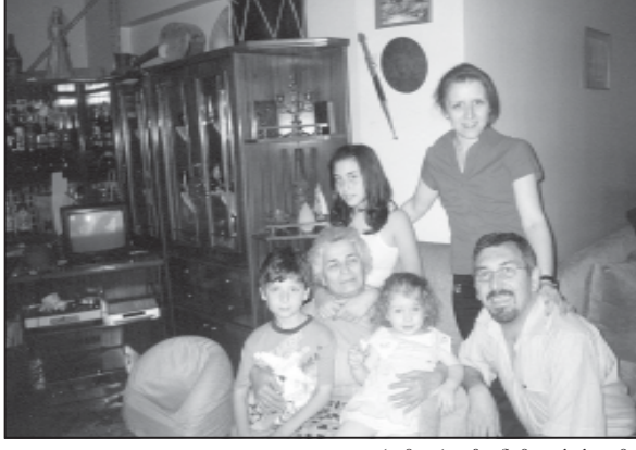
ლადა გამომწვევი მრავალი ფანჯრის მფლობელია...