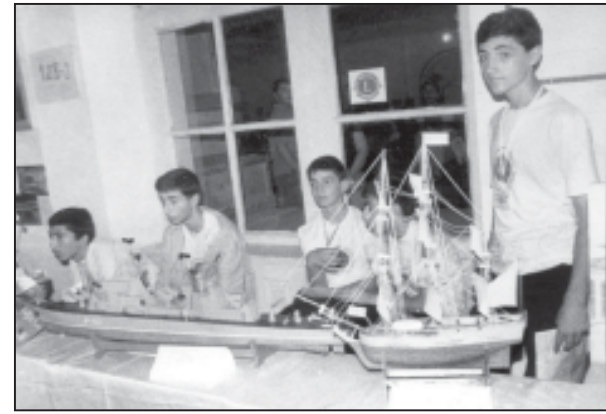
კონკურსის პირველი ადგილზე გა...