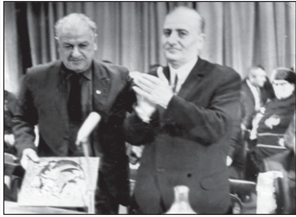
დამფუძნებელი ქართველი ფეხბურთელი ბორის პაიჭაძე სტუმრად საქართველოს სასოფლო-სამეურნეო ინსტიტუტში. მას სამახსოვრო საჩუქარს გადასცემს აგრარული ფაკულტეტის დეკანი პაველ გვარამაძე.