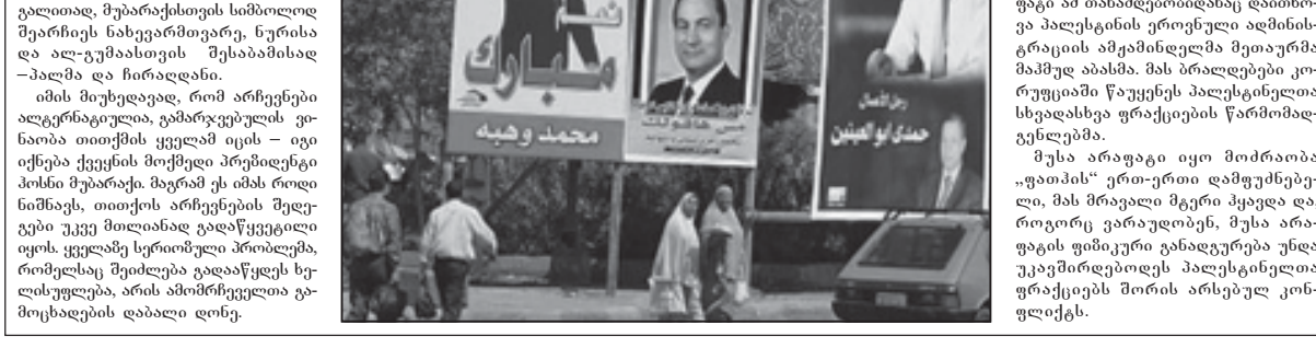
07 სექტემბერი, 2005 წელი