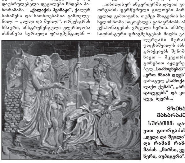
სურათის ავტორი კომპოზიტორია — ადაკარგული ორგანიზაციის მიერ...