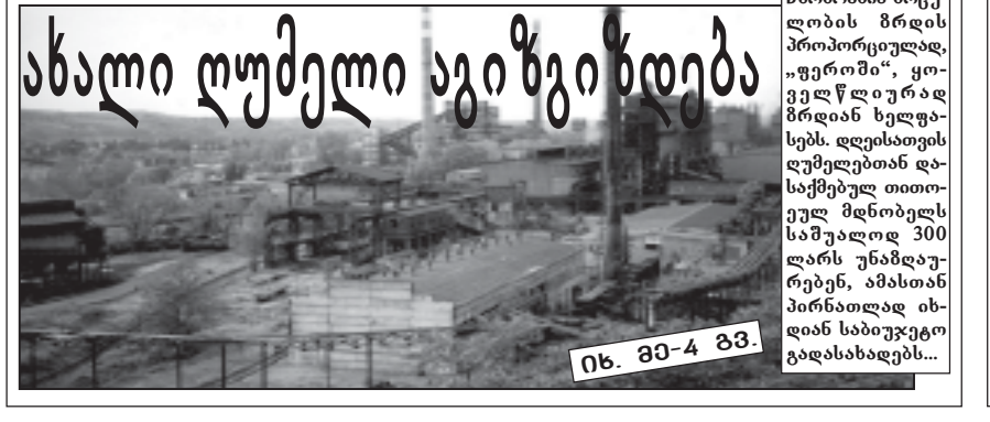
წარმოების მოცულობის ზრდის პროპორციულად, „ფეროში“, ყოველწლიურად ზრდიან ხელფასებს. დღეისათვის დამსაქმებელთა სასაქონლო ფონდის ღირებულება 300 ლარს უნაზღაურებენ, ამასთან პირნათლად იხდიან საბიუჯეტო გადასახადებს...