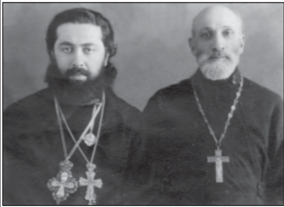
პრემიერ-მინისტრი ილია შილაშვილი (დღეს საქართველოს კათალიკოს-პატრიარქი, უწმინდესი და უნეტარესი ილია II) და დეკანოზი ვისლ გაბაბაძე 1960-იანი წლების დასაწყისში. ბათუმი.