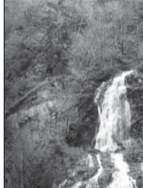
მდინარე იწვიარას პანორამა

... გობავარჩხილი, როგორც ლეგენდები გვყვებიან, მიწაქვეშაით უერთდება პატარა გობავარჩხილს! გარდა ამისა, იქ, შორეულ პერუსში თუ ბოლივიამი, არავის სმენია რისივერი გბის შესახებ! - თითონ „წაქაქარი“!