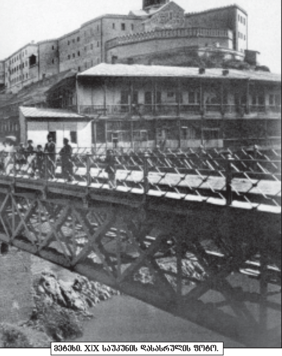
მეტეხი, XIX საუკუნის დასასრულის ფოტო.

მეტეხი, გაბართა და კლდის ციხე მეტეხსა წარითო ძაღალი, აიღო