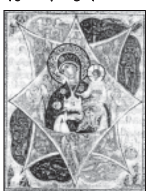
კი და არწივი, როგორც ხილული ნიშნები თიხის მხარხარების მონახობისთვის ცხოვრებებზე - დეობატივი და უსხეულო ცეცხლის ცხოვრებისა და სწავლების შესახებ, ყოველწლიურად ქალწულთა თავის წიაღში დაუწყველად რომ მიიღო.

17 სექტემბერს ქართულ სამოციქულო ეკლესიაში ღვთისმშობლის სასწაულომოქმედი ხატის „შეუწყველი მაყვალის“ დღესასწაული აღინიშნება.