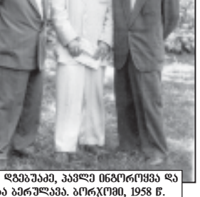
ბერბე ლაზარაძე, აკადემიკოსი და სსრკ-ის სახელმწიფო მშენებელი