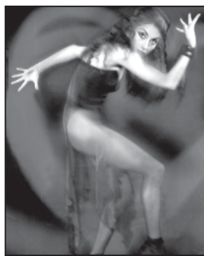
ენა სხვადასხვა რიგებზე აგებულ მონტაჟითა კასკად შეიქმნა...