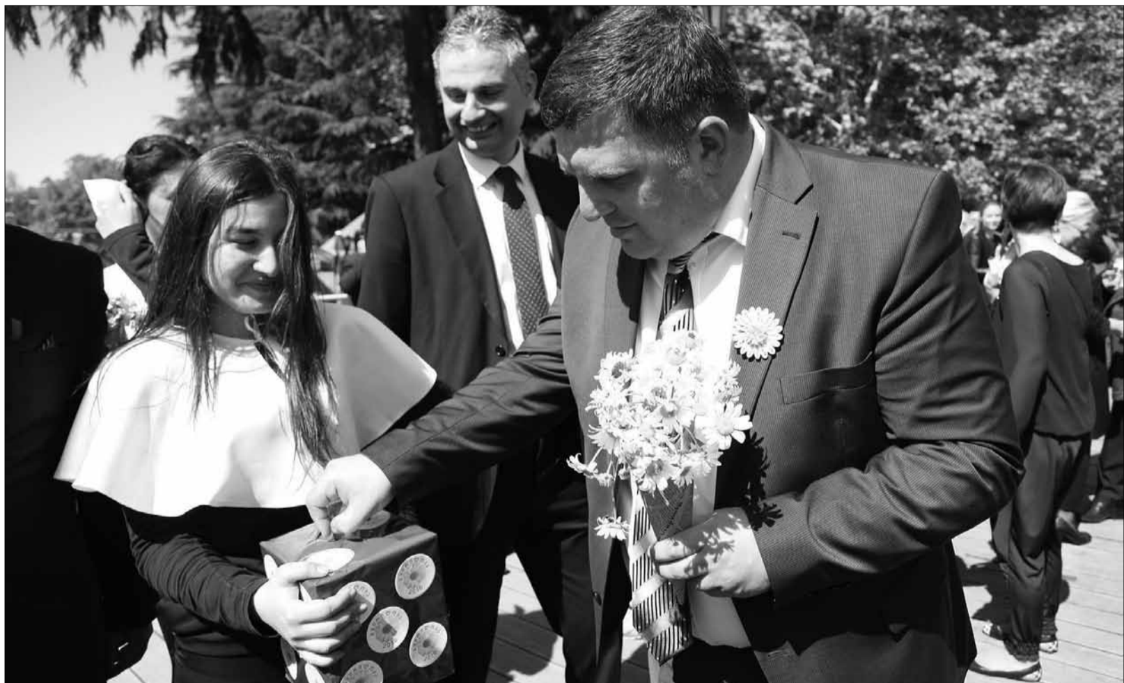
ქუთაისის მერმა „გვირილობის“ შესახებრი გაიღო