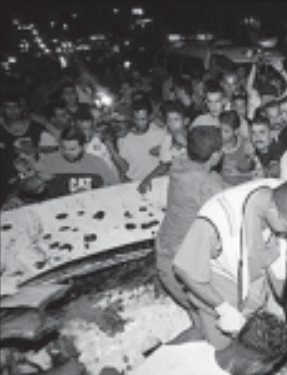
სარაკეტო დარტყმები მიყენეს სამიზნეებს დაზის სექტორში პალესტინელი მოთარეშების წინააღმდეგ მიმდინარე ოპერაციების ფარგლებში.

როგორც ისრაელის არმიის წარმომადგენელმა თქვა, დაზრეულია ხიდი დაზის ჩრდილოეთ ნაწილში, რომელსაც მოთარეშები იყენებდნენ იმ ტერიტორიებზე შესაღწევად, საიდანაც რაკეტებს უშენდნენ ისრაელის ქალაქებს.