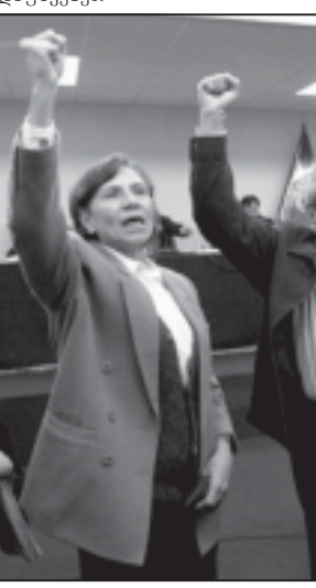
სასამართლო განიხილავს აბიმაელ გუსმანის საქმეს. იგი არის იატაკემა წინააღმდეგობის მოძრაობის „ნათელი გზის“ დამაარსებელი. ამ მოძრაობის წევრებს ბრალად ედებათ ბოლო 20 წლის განმავლობაში ათი ათასობით პერუელის მკვლელობა.

ხდარი სიტუაციის გამორეგება, როცა გუსმანი და მისი მეგობარი-ქალი სასამართლო პროცესის დროს ერთთავად გაიხიზნენ კომუნისტურ ლოპუნგებს და ამით მიღწეანად მიიპრეს პრესის ყურადღებას. ამჯერად სატელევიზიო კამერებს სასამართლო დარბაზში არ დაუშვებენ.