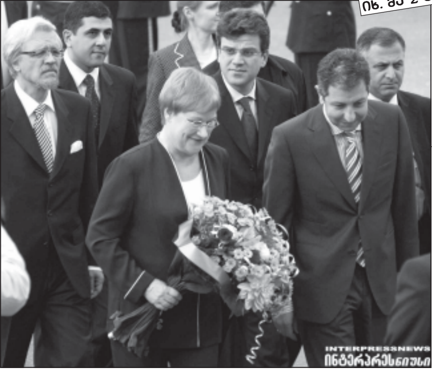
იხ. 80-2 გვ.

საქართველოში გუშინ ორდღიანი ოფიციალური ვიზიტით ფინეთის რესპუბლიკის პრეზიდენტი ტარია პალონენი ჩამოვიდა. ფინელ სტუმარს აეროპორტში საქართველოს პრემიერ-მინისტრი ზურაბ ნოღაიძე და ეკონომიკური განვითარების მინისტრი ირაკლი ჩოგვაძე დახვდნენ. ფინეთი მხარს უჭერს საქართველოში კონფლიქტების მშვიდობიანი გზით მოგვარებას. ამის შესახებ ფინეთის რესპუბლიკის პრეზიდენტმა ტარია პალონენმა საქართველოს პრეზიდენტ მიხეილ სააკაშვილთან ერთად გამართულ პრესკონფერენციაზე განაცხადა. ტარია პალონენის განცხადებით, ევროკავშირი დაინტერესებულია საქართველოს კონფლიქტების მოგვარებით, მაგრამ ეს მშვიდობიანი გზით უნდა მოხდეს. — ფინეთმა მხარი დაუჭირა და კვლავაც გააგრძელებს მხარდაჭერას მშვიდობიანი გზით კონფლიქტების მოგვარებას, — განაცხადა ფინეთის პრეზიდენტმა.