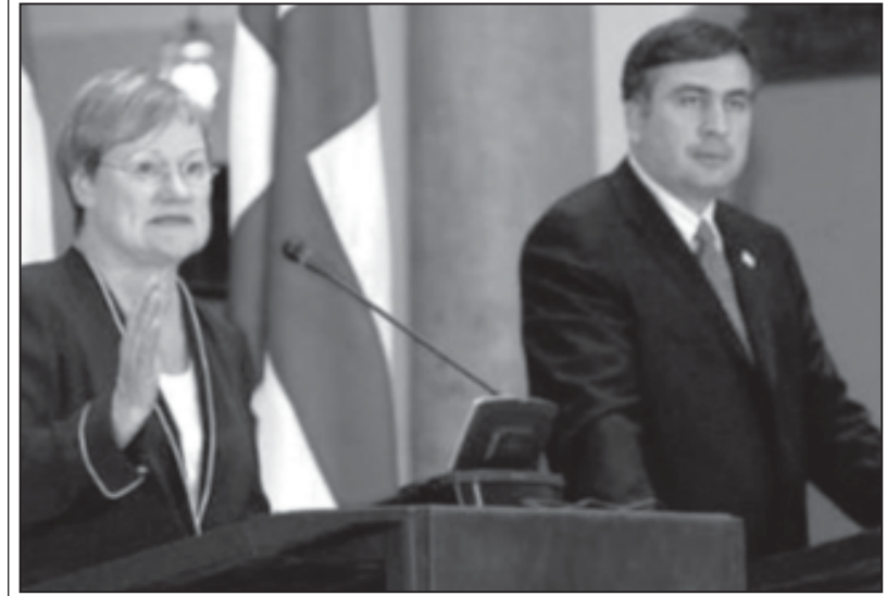
გაზეთი საქართველოს რესპუბლიკის პრეზიდენტის მიხეილ სააკაშვილთან ერთად გამართულ პრესკონფერენციაზე განაცხადა.

საქართველოში გუშინ ორდღიანი ოფიციალური ვიზიტით ფინეთის რესპუბლიკის პრეზიდენტი ტარია პალონენი ჩამოვიდა. ფინელ სტუმარს აეროპორტში საქართველოს პრემიერ-მინისტრი ზურაბ ნოღაიძე და ეკონომიკური განვითარების მინისტრი ირაკლი ჩოგვაძე დახვდნენ. ფინეთი მხარს უჭერს საქართველოში კონფლიქტების მშვიდობიანი გზით მოგვარებას. ამის შესახებ ფინეთის რესპუბლიკის პრეზიდენტმა ტარია პალონენმა საქართველოს პრეზიდენტ მიხეილ სააკაშვილთან ერთად გამართულ პრესკონფერენციაზე განაცხადა. ტარია პალონენის განცხადებით, ევროკავშირი დაინტერესებულია საქართველოს კონფლიქტების მოგვარებით, მაგრამ ეს მშვიდობიანი გზით უნდა მოხდეს. — ფინეთმა მხარი დაუჭირა და კვლავაც გააგრძელებს მხარდაჭერას მშვიდობიანი გზით კონფლიქტების მოგვარებას, — განაცხადა ფინეთის პრეზიდენტმა.