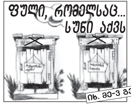
იხ. 80-3 გვ.