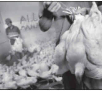
ნაზი ინფიცირებული ფრინველები

თავი შეიკავებ ნაზადირევის საცხოვრებელი შემობაში და იმ ადგილებში შეტანისაგან, სადაც შინაური ცხოველებია. არავითარ შემთხვევაში არ მისვით ნაზადირევი ფრინველის ნარჩენები შინაურ ცხოველებს და მონადირე ძაღლებს. ნადირევის შემდეგ მონადირე ძაღლებს გაუსუფთავეთ თათები და დარწმუნდით. კატეგორიულად იკრძალება თოვლებისა და სხვა გარეული ფრინველების კვერცხების შეგროვება და საკვებად გამოყენება. ფრინველთა ნივთების წმენდა უნდა ხდებოდეს სპირტით ან სპირტის ხსნარით. ეს პირდაპირ მოითხოვს დაავადებაზე დამუშავების შემდეგ ხელბი საფუძვლიანად უნდა დაინახოს საშინო.