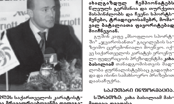
დემს საქართველოს კარატიტი-თა მრავალრიცხოვანა დელეგატი