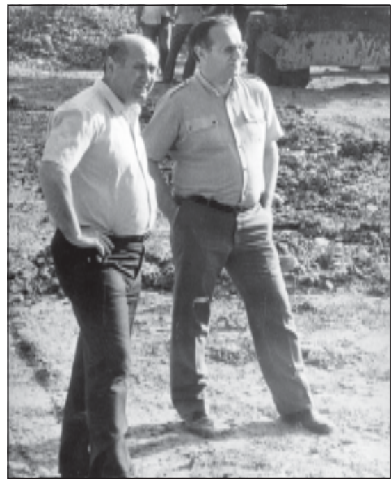
ლესი განათლებაც აქ გაასრულა. მისი შრომის წიგნაკი სქელბანაოცნებარ ქალაქის გიგანტურ ბი ასე თუ განადგურდებოდა...