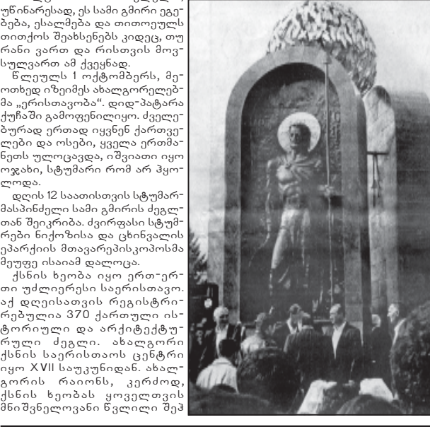
ახალგაზრდის ცენტრში დგას სამი სულბანის...

ახალგაზრდის ცენტრში დგას სამი სულბანის, სამშობლოსათვის მომხმარებელი აღსრულებული სამი გმირის, უკრის თანხლებით უკრავდები სულბანის — შალვა და ელიზბარ ქსნის ერისთავებისა და ბიძიანა ჩოლოყაშვილის ბრძანებით ჩამოსხმული ქანდაკებები.