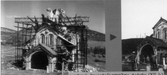
მცხეთის მთავარანგელოზთა ტაძარი (XII სს)

Общезвестно, что реставрационно-консервационные работы, проведенные на самом высоком уровне, интересны, если не обеспечены стойкостью и «жизнеспособностью» их результатов.