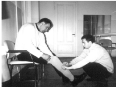
Бышлый Тбилисский ортопедический завод Департамента инвалидов Грузии несколько лет назад был переименован в социально-