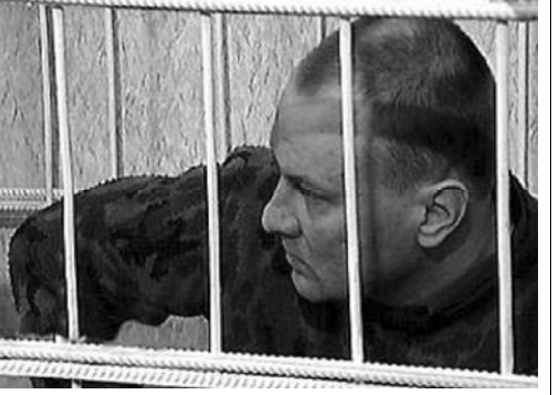
СИЗО квалифицированной помощи, находится в предсудебном состоянии.