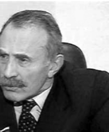
администрации республики Ахмада Кадырова, сообщает Коммерсант.Ru со ссылкой на правовое управление чеченского правительства...