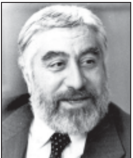
„ვილფონი“, გორის მინისტრის პირველი მოადგილე, უპირატესი, შუამდგომლობის განმარტების...