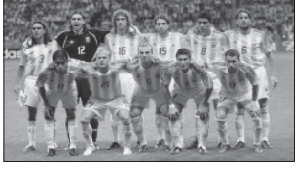
მსოფლიო ჩემპიონატის (1978, 1986) ფინალისტთა წარგლენას...