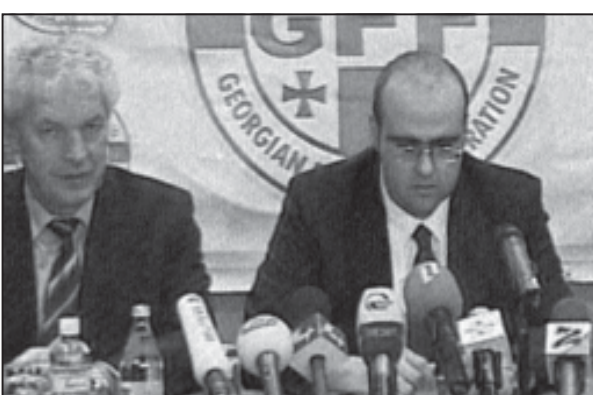
საპარტიო პროცესები საბოლოოდ... დაიწყო...