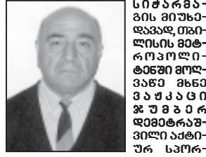
ჩიონისპირეთსა და ჩრდილო კავკასიის... რეპორტი...