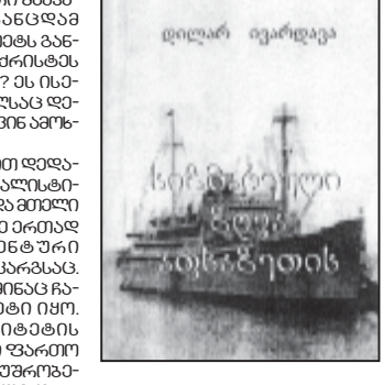
ალბათ მომავალ თარგმანს ხშირად შეგვხვება კითხვა...