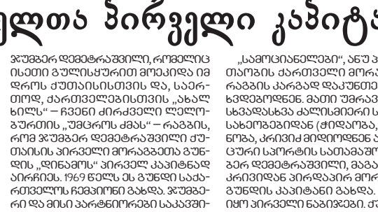
ცხოველებისთვის მსხვერპლსაც გაიღებს... გაუთინ საპარტიო ფორმირების...