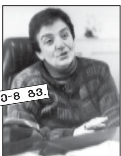
ნ.ბ. 20-8 გვ.

გუნა გვარცხელია: ენობრივ- სტილისტიკური თვალსაზრისით მისაბაძიც პი არის სხვა გაზეთებშითვის