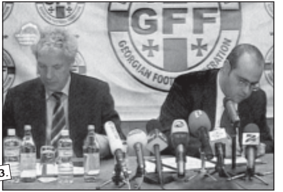
ნ.ბ. 20-7 გვ.

ვიგელოვებთ, კლა- უს ტოპიოლარს წი- ნამოგებდებთან შე- დარებით უკეთესი ხვედრი ელის.