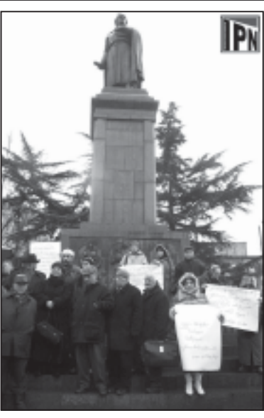
ფაქციური კი, სწორად რომ, აუტანელი გაძირვებისა.