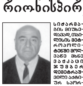
მსოფლიო ჩემპიონატის ფინალისტთა წარგლენას...