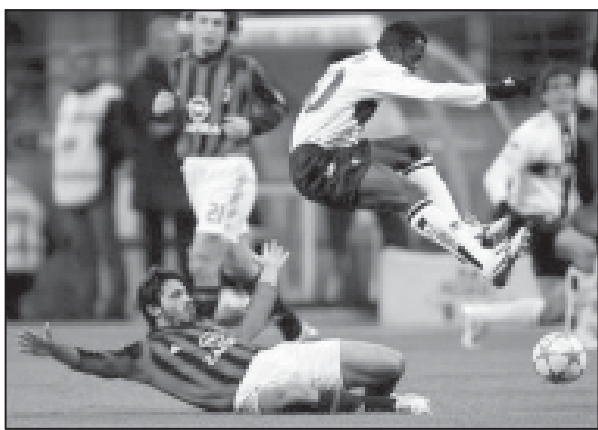
ლივერპო ჯგუფი. „პარმა“ - „პალერმო“ 4:3, „სიენა“ - „იუვენტუსი“ 1:2, „სამპდორია“ - „ლივერპო“ 0:2, „ლაციო“ - „ასპირინი“ 4:1, „ტრევიზო“ - „რომა“ 0:1, „პალერმო“ - „უდინეზე“ 2:1, „კიევიო“ - „ლეჯე“ 3:1, „ემპალი“ - „მილანი“ 1:3, „ვილიანი“ - „პარმა“ 4:3.

იტალია. XVIII ტური. „რეჯინა“ - „ფიორენტინა“ 1:1, „პალერმო“ - „იუვენტუსი“ 1:2, „სიენა“ - „ინტერი“ 0:0, „სამპდორია“ - „ლივერპო“ 0:2, „ლაციო“ - „ასპირინი“ 4:1, „ტრევიზო“ - „რომა“ 0:1, „პალერმო“ - „უდინეზე“ 2:1, „კიევიო“ - „ლეჯე“ 3:1, „ემპალი“ - „მილანი“ 1:3, „ვილიანი“ - „პარმა“ 4:3.