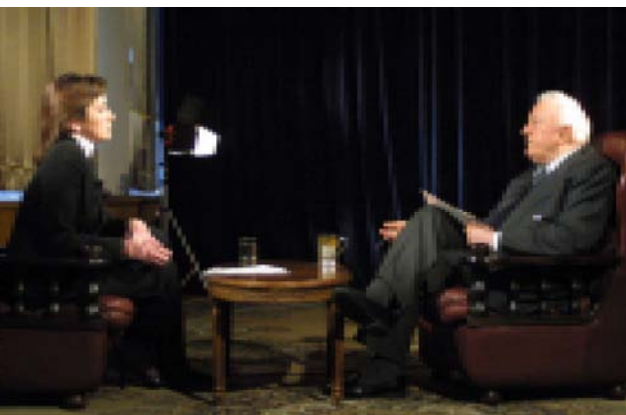
«Вчера, 15 мая, по каналу телекомпании “Рустави-2” Президент Грузии Эдуард Шеварднадзе дал интервью журналистке Эне Хоппер. Предлагаем полный газетный вариант интервью.»

ИНТЕРВЬЮ ПРЕЗИДЕНТА ГРУЗИИ ЭДУАРДА ШЕВАРДНАДЗЕ ТЕЛЕКОМПАНИИ “РУСТАВИ-2”