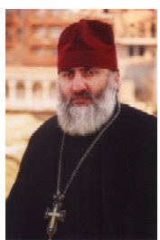
Такой храм напоминает нам об искуплении нас смертью Спасителя на кресте.

А храм, построенный в виде креста? Такой храм напоминает нам об искуплении нас смертью Спасителя на кресте. То же касается храма в виде круга, то он призван уверждать, что Церковь Христова будет существовать вечно.