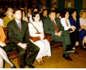
Правильно ими пользоваться - Поздравил коллектив школы и помощник Президента...

В результате сотрудничества в школе уже год функционирует кабинет по изучению чешского языка, наблюдаются значительные успехи.