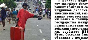
Бегство из Монровии