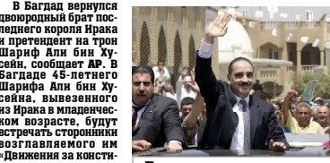
Так встречали потенциального короля на улицах Багдада