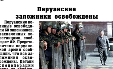
Марксисты не прошли