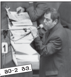
იხ. გვ-2 გვ.

მიუხედავად იმისა, რომ ოპოზიციის მტკიცებით, ირაკლი ოქრუაშვილი პრივილეგიურულ მინისტრთა კატეგორიას მიეკუთვნება, მას გუშინ პარლამენტში სამთავრობო საათზე გამოცხადება მოუწია. თუმცა, ბოლო დღეებში გამართული კინკლაობა ამით არ დასრულებულა. ფრეჯია „დემოკრატიული ფრონტის“ წევრი კახა კუკავა და სხვა ოპოზიციონერები მანინც უკმაყოფილონი დარჩნენ, რაკი სამთავრობო ლოჯაში შინაგან საქმეთა მინისტრი ვერ იხილეს. პარლამენტის თავმჯდომარის თქმით, ვანო მერაბიშვილმა დეკლარაციას კითხვებზე, რომლებიც ზურაბ ჟვანიას გარდაცვალების გარემოებას უკავშირდებოდა, წერილობით უპასუხა, ამდენად მისი მოსვლა საჭირო არ იყო. დავით ბერძენიშვილმა სპიკერს განუმარტა, სხვა უამრავი შეკითხვა უნდა დაეფხვრა მერაბიშვილს და რაკი პასუხის გასაცემად მზადყოფნას აცხადებს, იქნებ მოზრძანდესო. ნინო ბურჯანაძემ ოპოზიციის წარმომადგენლებს გარანტია მისცა, რომ კითხვების რეგლამენტით დადგენილი წესით გაფორმების შემდეგ შინაგან საქმეთა მინისტრი პარლამენტში გამოცხადდება.