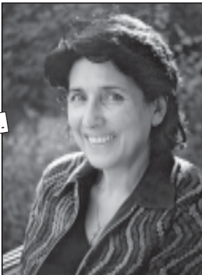
იხ. გვ-3 გვ.