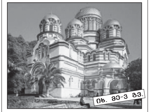
იხ. გვ-3 გვ.