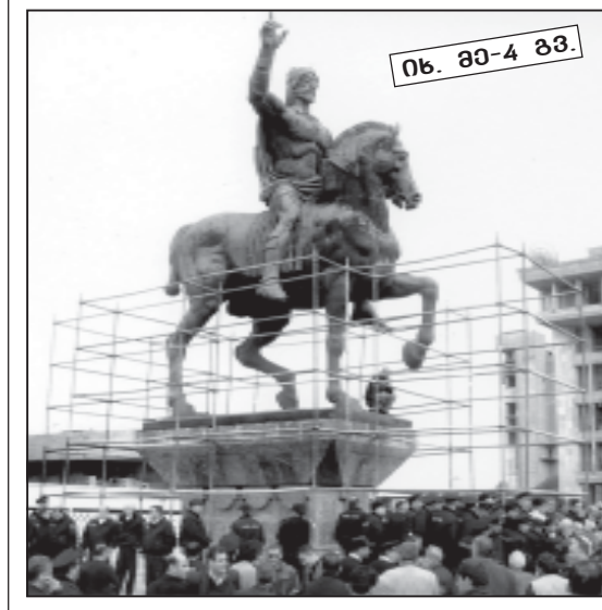
იხ. გვ-4 გვ.

ელექტრონული ფოსტა: sakresp@go.ge ვებ გვერდი: www.open.ge/sakartvelos-respublika ჩვენს გაზეთს კითხულობენ აშშ-ში, გერმანიაში, რუსეთში, პოლანდიაში, საფრანგეთში, უკრაინაში, ისრაელსა და სხვა ქვეყნებში. ფასი 50 თეთრი.