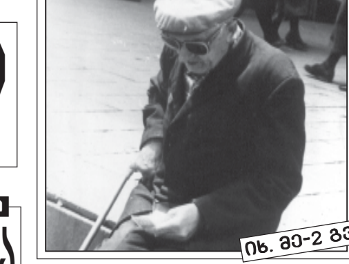
იხ. 80-2 გვ.