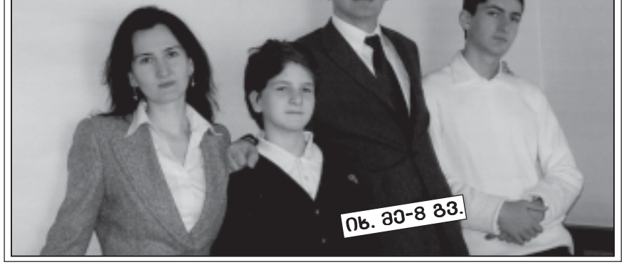
იხ. 80-8 გვ.

11 წლის დედაბრა გამსახურდია სამთავროს რუკაზე ვიპოვებ დახატა