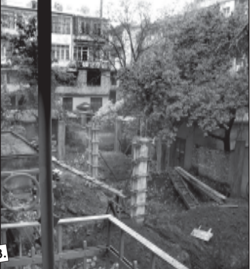
იხ. 80-3 გვ.

ბატონო პრეზიდენტო, მაღალი რანგის ჩინოვნიკებს თქვენამდე სათქმელი არ მოაქვთ. საკითხის მოგვარებაში ან არ ერევიან, ან მას კანონსაწინააღმდეგოდ წყვეტენ, ვისაც ფარველები პარლამენტში ან მთავრობაში ჰყავთ.