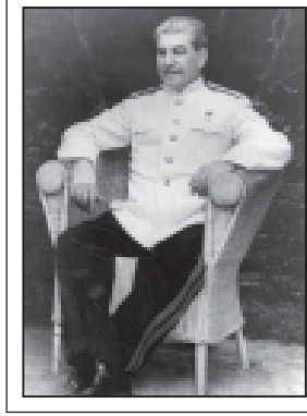
იხ. 80-5 გვ.