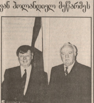
საქართველოს საგარეო ურთიერთობების სამსახურის დირექტორი...