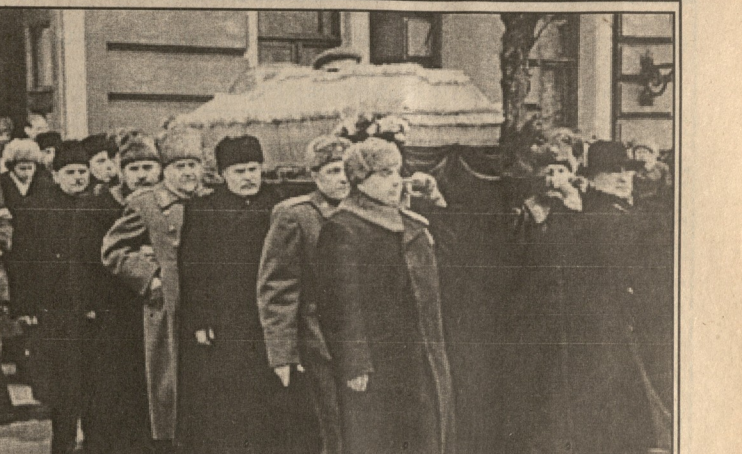
საქართველოში ინტელსური მართი...