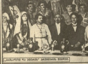
მედიუმის მედიუმები და სხვა