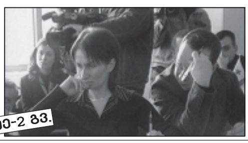
ნ. 30-2 გვ.

როგორი აუდიტი დათვლის კობა ბეჟაშვილის მონებას? ბუღალტრების, მაკლეონისა და უნგრეთის პრეზიდენტების სტუმრის სტატუსით ფორუმს დაესწრებენ ბეჟაშვილი, ეუთოს, ევროკავშირის და ნატოს წარმომადგენლები, ასევე ბრიტანეთის პრემიერ-მინისტრი ტონი ბლერი.