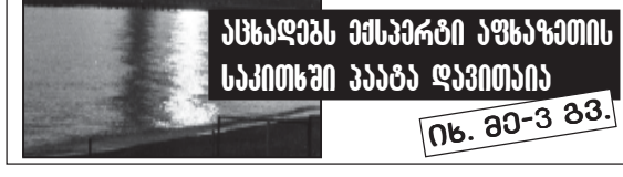
ნ. 30-3 გვ.

შაშაბა აღიარებითი ჩვენება მოძეცა, — ასხადავს მსაპრტი აფხაზეთის საკითხში პაპა დავითაია