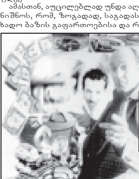
ალური ეკონომიკის ზრდა მომავალ...