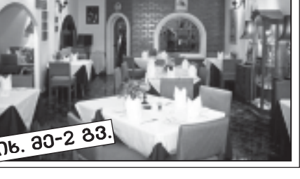
ნ. 30-2 გვ.