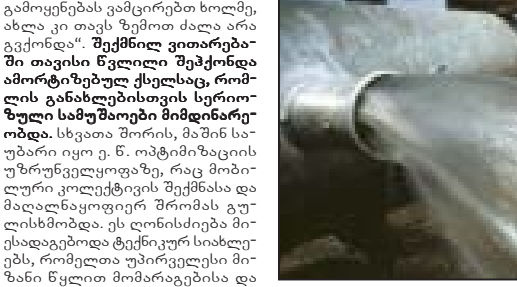
აუღებს და ვერც ვარკეთილისა...