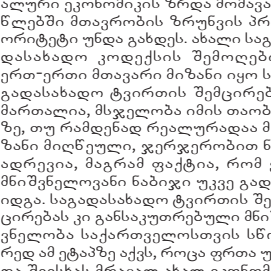
ალური ეკონომიკის ზრდა მომავალ...