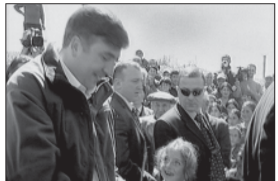
ალარაფერის ვამპირ ჩინოსანთა 3-5...