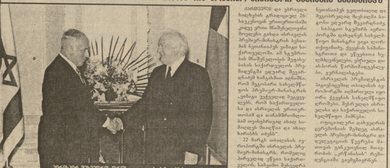
მინისტრი მამუკაშვილი, ისრაელის პრემიერ-მინისტრი ბენიამინ ნეთანიუა