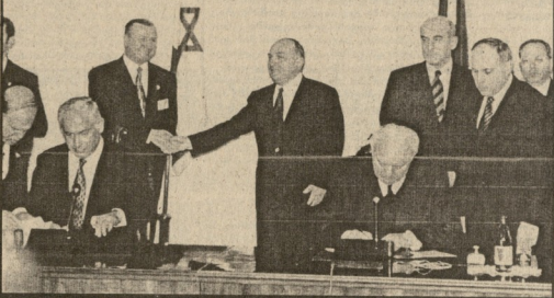
პრეზიდენტი ედუარდ შევარდნაძე და მთავრობის თავმჯდომარე ჯვარცხელია ზვიად ნიზაძე.

საქართველოს რესპუბლიკის პრეზიდენტის და მთავრობის ურთიერთობის შესახებ