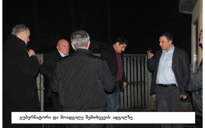
გუბერნატორი და მოადგილე შემთხვევის ადგილზე

დომარე ამირან გვიგინიშვილი, მოადგილე ზვიად აფხაზაე, გამგებელი ზაზა ურუშაძე, მისი მოადგილე ვახტანგ ზენაიშვილი და პოლიციის მაღალჩინოსნები. ყველა მათგანმა დაგმო ჟურნალისტზე თავდასხმა და განაცხადეს, რომ ყველაფერს გააკეთებენ, რომ ბოლი მოელოს ლანჩუთში ასეთ მივარდნებს და მით უმეტეს, შუიდად მუშაობის საშუალება მიეცეთ ჟურნალისტებს. „ეს ფაქტი, თავისთავად, დასაგმობია. არავის აქვს უფლება, მოედეს ჟურნალისტთან და უსაყვედუროს საგაზეთო ნერილის გამო, შურაცხყოფაზე აღარაფერს ვამბობ. ყველაფერს აქვს ფორმა, არსებობს კანონი, რომლის ფარგლებს არ უნდა გასცდეს არავინ. ყველაზე სამსუბარო ის არის, რომ იხინი არ იყვნენ უბრალო მოქალაქეები, ისინი არიან ადამიანები, რომლებიც ბიუჯეტადან იღებენ ხელფასს, მათი პასუხისმგებლობა გაცილებით მაღალია. აქედან გამომდინარე, ყველამ სრული სიმკაცრით უნდა აგოს პა-