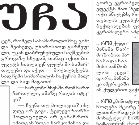
თქვენ რას დაარქვით?