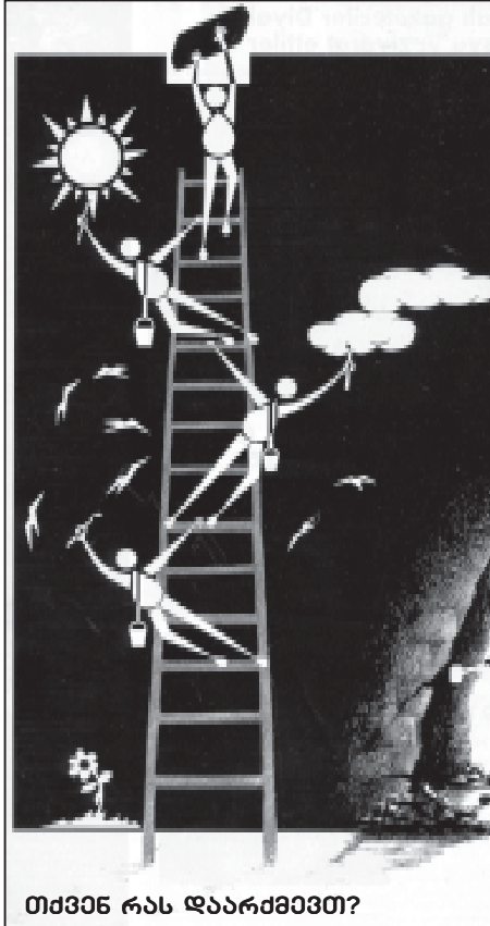
თქვენ რას დაარქვით?