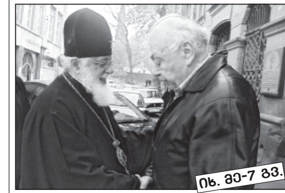
იხ. გვ-7 გვ.

ახლაც გარდამავალი გლობალიზაციის პერიოდი, როცა საფრთხის ქვეშ დგება ეროვნული და სულიერი ფასეულობა. დღეს ყველამ უნდა იცოდეს რა პოზიციაზე დგას და რა პოზიციაზე უნდა იდგეს ქართველი ადამიანი.