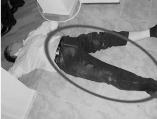
ყოფილა გრიფით „საიდუმლოთი“ დაცული საქმე. სისხლის სამართლის საქმეა, რომელსაც არ ახსავარობდა

— სამხარაული ზურაბ ადგიმუხომბის მეგობარი და ინტერესების გამტარებელი იყო ჯერ უშიშროების სამინისტროში. გენერალური პროკურორი რომ გახდა, ის გადაწყვიტა ექსპერტიზის ბუროში. ძალიან დამოკიდებული იყო ადგიმუხომბზე. ადგიმუხომბის დავალებებს ის თვალდახუჭული შეასრულებდა. ნაკითხე, რომ თითქოს, მან რაღაცა დასკვნა დადო და ამ დასკვნის გამო არის ვარაუდი, რომ მოიშორეს. არა მგონია, რომ ეს ახლოს იყოს საღ გონებასთან. ვერანაირ დასკვნას სამხარაული ვერ დადებდა, იმიტომ, რომ დასკვნას ექსპერტები აკეთებენ. სამხარაული ცდილობდა, რომ ექსპერტებს დაენერათ ხელისუფლებისთვის სასარგებლო დასკვნები. ის არ იყო ადამიანი, ვინც სინაერთლის დადგენას ცდილობდა. მაგრამ, ის, რომ ლევან სამხარაულის