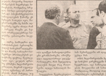
საბარბა შიული შარბაზა და მისი ბაბი, შიული შარბაზა და მისი ბაბი...