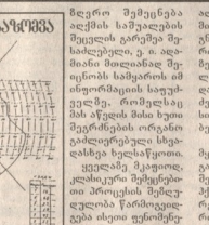
პოლიეთილენის პოლიმერის მონომერული რეზინის სტრუქტურული ფორმულა