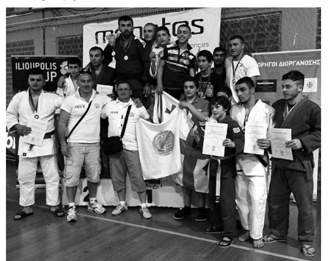
რუბრიკა მოამზადა ირაკლი თავაძემ