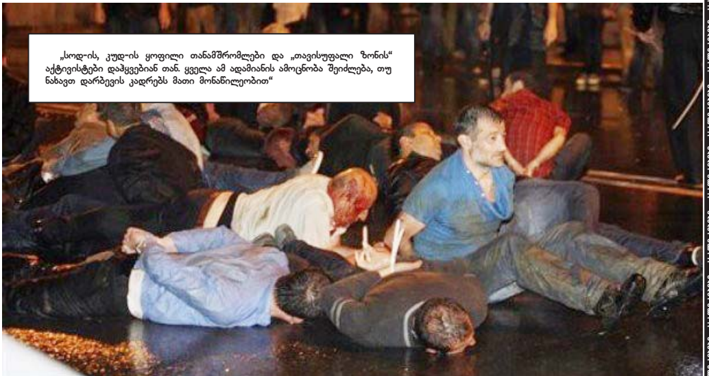
„სოდ-ის, კუდ-ის ყოფილი თანამშრომლები და „ათვისუფალი ზონის“ აქტივისტები დაწყებინ თან. ყველა ამ ადამიანის ამოცნობა შეიძლება, თუ ნახათ დარბევის კადრებს მათი მონაწილეობით“

მიუხედავად ამისა, რამდენიმე წარწერის მოკითხვა ოფისის ირვლევი მაცხოვრებლებმა შეძლო: „ქართულმა ოცნებამ“ ხალხს უღალატა“, „ბიძინა, შენ გაგაცივრე იმედები“ და ასე შემდეგ... (თეზისტი)