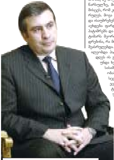
„ხალხში გადიან და უშვებენ ინფორმაციას, რომ სააკაშვილი მალე დაბრუნდება არა მხოლოდ საქართველოში, არამედ ხელისუფლებაში და ყველას სახელსა და გვარს გადაეცემთ, ვინ არის ჩვენი მომხრეო. ასევე უზუნუნებია, ხომ იცით, რა მეთოდებით ვმართავთ ხელისუფლებას, კი არ დაგვიწყნებიაო“

ის კადრებს მათი მონაწილეობით. ახლა იგივე მეთოდებით ცდილობენ, მოაგებინონ მათი კანდიდატს, რაც მათთვის ჩვეულია. სხვათა შორის, მე სრული ინფორმაცია მაქვს ირანის წარსულზე, მის გამო ორ ადამიანს 7 წელი მისცეს, რომ კონკრეტული დავალება არ შეასრულეს. მოვა დრო, ეს ადამიანები გამოვლენ და ისაუბრებენ ამ ვალათის წინააღმდეგ. მალე აეზღვება ფარდა იმასაც, რას აიძულებდა ის პატიმრებს და როგორ აყურებინებდა ერთ პატიმარს მეორის წამებას, რომ ამით მიეხედვინებინა, რა მოელოდა, თუ მის დავალებას არ შეასრულებდა. პირადად გიორგი ირანი მონაწილეობდა პატიმრების ცემასა და წამებაში.