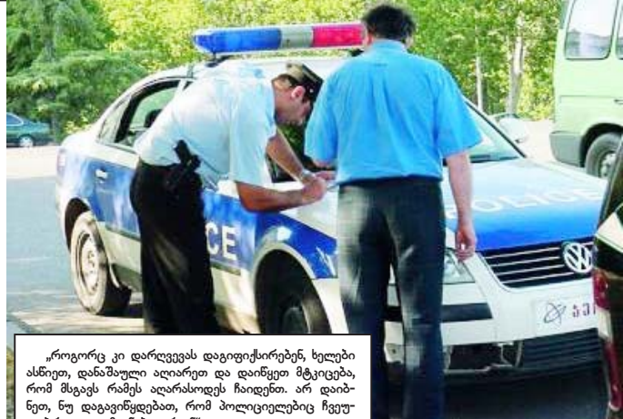
„როგორც კი დარღვევას დაიფიქსირებენ, ხელები ასწვით, დანაშაული აღიარებ და დაიწყებ მტკიცება, რომ მსგავს რამეს აღარასოდეს ჩაიდენ. არ დიზნე, ნუ დაგვიწყნებთ, რომ პოლიციელებიც ჩვეულებრივი ადამიანები არიან“

ველობის გაუმჯობესებას, სამართალდარღვევითა ფეხტურ პრევენციას და აღკვეთას, საზოგადოებრივი წესრიგისა და უსაფრთხოების დაცვას, საკანონმდებლო ხარვეზებისა და უზუსტობების აღმოფხვრას. დაახ, ასეთია ოფიციალური განაცხადი, ყველა კანონპროექტი მიზნად ისახავდა მდგომარეობის გაუმჯობესებას და არა გაუარესებას. თქვენს ყურადღებას ამჯერად შევაჩერებთ რამდენიმე აქტუალურ საკითხზე, რაც მეტად მტკივნეული იყო მოქმედი მძღოლებისთვის. მართალია, ამჯერად რამდენიმე საკითხის გამოკლება მოგვიწევს, მაგრამ არის ერთი, ასე ვთქვათ, ახალი პრობლემა, რომლის შესახებაც კონკრეტულად ქვემოთ მოგახსენებთ: პირველი – ძალიან ბევრს აწუხებდა სხვადასხვა მიზეზებით ჩამორთმეული მართვის მოწმობის აღდგენის საკითხი, რამდენიმე შემთხვევაში საჭირო იყო გამოკვლების სხვახალა ჩაბარება. ოფიციალური მონაცემების თანახმად, ამ მხრივ, ბარიერები მოიხსნა და 2013 წლის 27 დეკემბრიდან 17800 მოქალაქეს განუხლებდა სატრანსპორტო საშუალების მართვის უფლება. ამავე დროს, განახევრდა ჯარიმისა და საურავის გადაუღებლობის გამო მართვის უფლების შეჩერების ვადები. მეორე – ასევე აქტუალური იყო სიჩქარის გადაჭარბებაზე დაწესებული ჯარიმები.