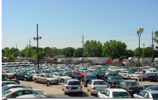
„აბა, სომხეთი რატომ შევიდა საბაჟო კავშირში? ევრობიდან ჩამოსაყვანი მანქანების ფასი სომხებს ლამის გაუოთხმადდა და როგორც მითხრეს, იქაური მოსახლეობა ლამის გაგიჟებულია. თუკი რამე სარგებელი არ აქვს, რატომ გადაიკიდეს მოსახლეობა, გამაგებინეთ...“

ზვეც ტრადიციულად ვიყავით. — რუსეთის ბაზარს გულისხმობთ? — დიახ, რა თქმა უნდა, არა პოლი-