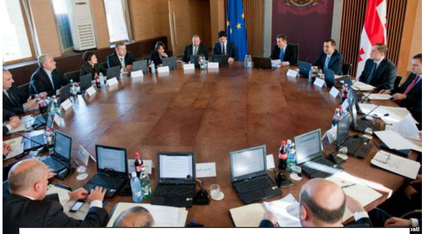
„იმ ვაგუს ვებმძღვანელობდი, რომელმაც განვითარების კონცეფცია, ეკონომიკა, სოფლის მეურნეობა, გარემოს დაცვა გააკეთა და ყველაფერი ძალიან დეტალურად მაქვს წარმოდგინილი. სამწუხაროდ, დღევანდელ ხელისუფლებას ეს არ სჭირდება, რადგან საკუთარი შეხედულებები გააჩნია, მაგრამ ეს შეხედულებები შედგეს ვერ იძლევა.“

— ასეთი კითხვა მაქვს ხელისუფლებამ რა განცხადებებიც არ უნდა აკეთოს ეკონომიკურ ვარდნას ყველაზე საკუთარ ტყავზე გვრძობთ. რას