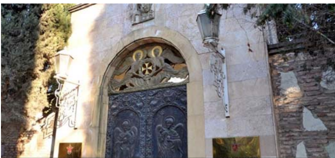
„ამიტომაც იყო, რომ ღმერთმა მოგვცა ნიშანი, ხომ ხედავთ, რა ღვთის რისხვა დაატყდა დარიალის ხეობას. ღმერთი ზემოდან არ ჩამოვა და არ გვეტყვის ეს მე გაეკეთო. როგორც აღდგომის წინა დღით გვიგზავნის სასწაულებრივ ცეცხლს და ამით თანადგომას გვიდასტურებს, ასევე, ჩვენვე უნდა მივხედოთ სასჯელსაც“

ტყდა დარიალის ხეობას. ღმერთი ზემოდან არ ჩამოვა და არ გვეტყვის ეს მე გ ა ვ ა კ ე თ ე ო . როგორც აღდგომის წინა დღით გვიგზავნის სასწაულებრივ ცეცხლს და ამით თანადგომას გვიდასტურებს, ასევე, ჩვენვე უნდა მივხედოთ სასჯელსაც.