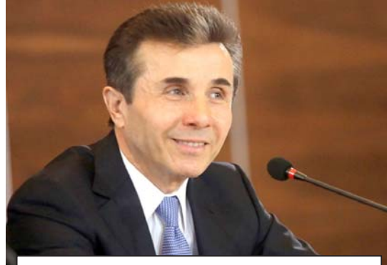
„ინკოგნიტო წყაროს ინფორმაციით, ივანიშვილის მიერ მომზადებულმა წერილმა, რომელიც „რესპუბლიკელების“ გასანადგურებლად არის გამიზნული და დღის სინათლე უსუფაშვილის ხეცნა-მუდარის გამო ვერ იხილა, მათ ჭკუა ვერ ასწავლა“