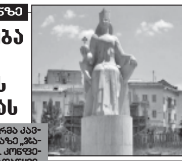
ნ. ბ-6 გვ.

სომხეთის „ნიკოლ პავლიანი“ სტუდენტურმა კავშირმა ირანში გამართა კონფერენცია თემაზე „ჯავახეთი XXI საუკუნის გამოწვევების წინაშე“.