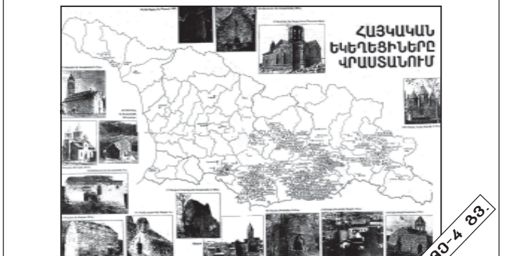
ნ. ბ-4 გვ.