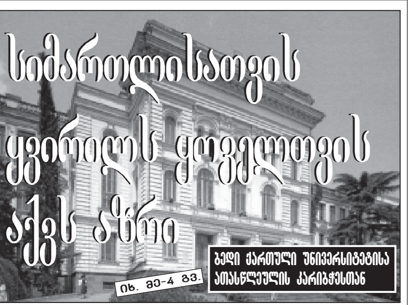
ნ. ბ-4 გვ.

სიმართლისათვის ყვერილს ყოველთვის აქვს აზრი