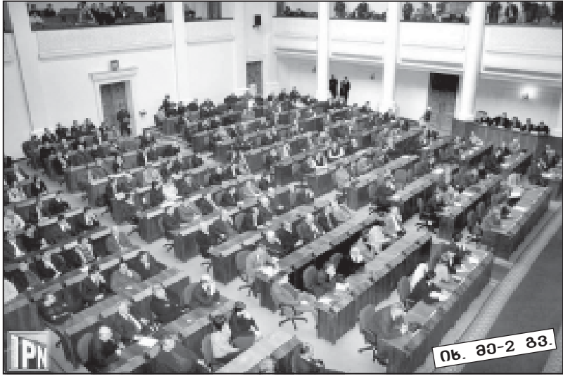
ნ. ბ-2 გვ.

ელექტრონული ფოსტა: sakresp@gol.ge ვებ გვერდი: www.open.ge/sakartvelos-respublika ჩვენს გაზეთს კითხულობენ აშშ-ში, გერმანიაში, რუსეთში, პოლანდიაში, საფრანგეთში, უკრაინაში, ისრაელსა და სხვა ქვეყნებში. ფასი 50 თეთრი.