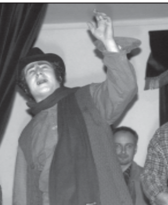
თეატრისი ამოქმედება... გვანამბრეშის თეატრის...