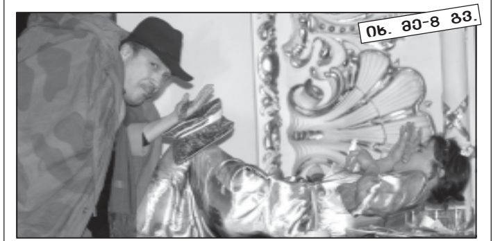
ნ. ბ-8 გვ.