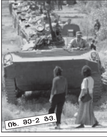
ნ. ბ-2 გვ.