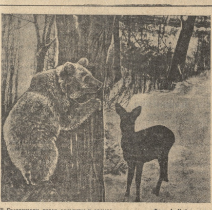
В Грозненском парке культуры и отдыха.