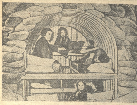
НА СНИМКЕ: внутренний вид бомбоубежища Андерсона в Англии.