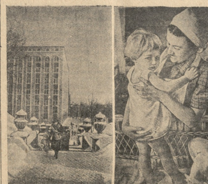
В новых советских республиках. На СНИМКАХ: слева — здание Наркомата лесного промысла Литовской ССР в г. Таляине; справа — в новых деревнях № 1 в г.ор. Куявасе (Литва). Фото ТАСС.

НЬЮ-Йорк, 25. (ТАСС). Как передает агентство Ассошиейтед Пресс, абиссинский Негус Хайле Селассие вылетел из Хартура на англо-американском самолете в сопровождении английского офицера и бывшего военного министра Абиссинии сэра Касса. Самолет приземлился на секретном аэродроме в Абиссинии, откуда вылетел в Адис-Абебу, чтобы присоединиться к английской военной миссии и английским регулярным частям, находящимся в Абиссинии.