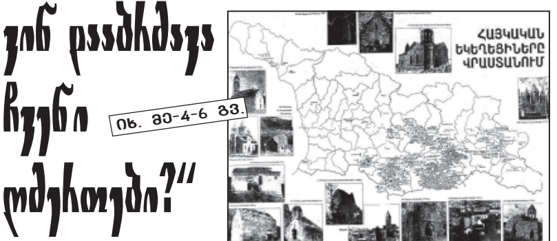
ქართული ეკლესიების მისაკუთრება გრძელდება...