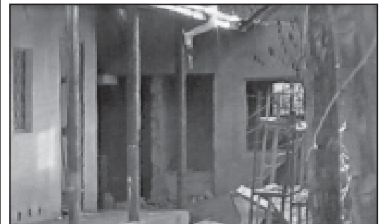
ნ. მ-3 გვ.