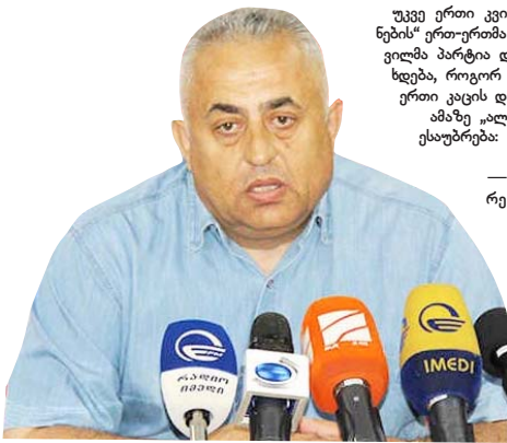
დაეკარგეთო, ნამდვილად მოგატყუებ. ეგენი რომ რიგითი ჯარისკაცების დაკარგვებ...

რა რეაქცია ჰქონდა „ქართულ ოცნებას“ პარტიის ერთ-ერთი დამფუძნებლის წასვლაზე?