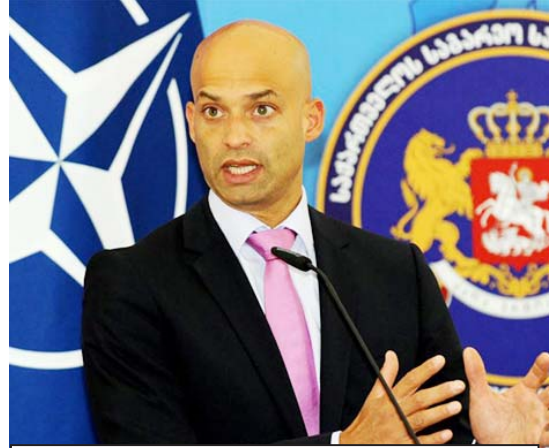
„ყველაზე მთავარი მესიჯი, რაც ვეიშმა აბატურადი თქვა...“