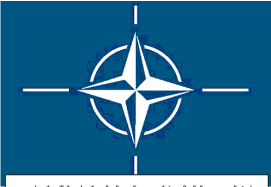
„ეს არ იქნება ის, რაც ჩვენ გვინდა და რასაც ჩვენ მოველით ნატოს-გან...“