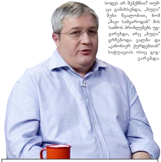
„არყის ხუროშინი გვიყვარება, წერას ჰყავს ატანალი... გვი სოციალურ ქსელში შესს პოსტებს ხშირად ვკითხულობ, როცა პრემირს „პატარა ბიჭად“ მოიხსენიებ, შენი ბიოგრაფიიდან რატომღაც ცუდი ისტორია მახსენდება, ჰოდა, გკითხავ, რა იყო, გვი, „პატარა ბიჭი“ ხომ არ მოგეპატარა?“