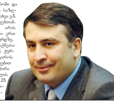
„სხვათა შორის, თქვენს ქვეშაღსია ლიდერს და მის გარემოცვას ისე მოხსონდა ენ. კანონიერი ქურდების ინსტიტუტი, თავისი შინაარსით, რომ თავად შექმნა ამ მოდელის საბეჭდო, რეგულირება, გატაცება, მკვლელობა, ქონების ჩამორთმევა, „კომპიკსი“ ფულის დადება, მიზა კიდევ უფრო შორს გაფრინდა და ქურდულს ბოზურც მუშარია, ჩაშვება, ფარული გადაღება, გაუპატიურება, აბსოლუტური უსამართლობა და ადამიანების სულიერი გაბაზება ვინ იყო მიზა? თქვენი ლიდერი ერთი ნაბოზარი კურდულყოფი იყო, რომელსაც მთელი ცხოვრება „კი ბიჭები“ თავში უზანახუნებდნენ, მას შემდეგ ჰქონდა კომპლექსი, რომ ის ვერ შედგა მამაკაცად“

ქურდულ სამყაროში და აქვთ კავშირები საზღვარგარეთ მყოფ სხვა ენ. კანონიერი ქურდებთან. ასევე, ძებნა არის გამოცხადებული ერთ ენ. კანონიერი ქურდზე. შინაგან საქმეთა სამინისტრომ ენ. ქურდული სამყაროს წევრობის ბრალდებით 2013 წელს 70 პირი დააკავე, 2014 წლის 6 თვეში კი – 25 პირი. შედარებითის, ნინა ხე-