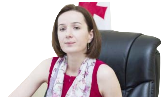
„პრეზიდენტი წარადგინა პარლამენტში მინისტრებს, ამიტომ აქ გარეგნაა შედეგი, რომ ხელს მოგინა არა, მაგრამ ჩემს კანდიდატურას ხელი არ მოკიდო. არაერთი ჩემი ახლობლისგან მომისმენია, რომელიც განათლების სამინისტროსთან კონტაქტშია, რომ სანიკიძის განათლების მოლოდინი იყო, რადგან ის არ ფლობდა პროფესიონალისთვის საჭირო თვისებებს“

ლად სტრუქტურის ოპტიმიზაციისა, ასეთ ფაქტებს ვხედავთ. ჩვენსიორი ქვეყნისთვის 20 მინისტრია საჭირო არაა, 14-იც საკმარისია, მაგრამ ხელს არ კიდებენ, რადგან აწყობთ ის საკარგად თავის ხელფასთან-პრემიერთანადა.