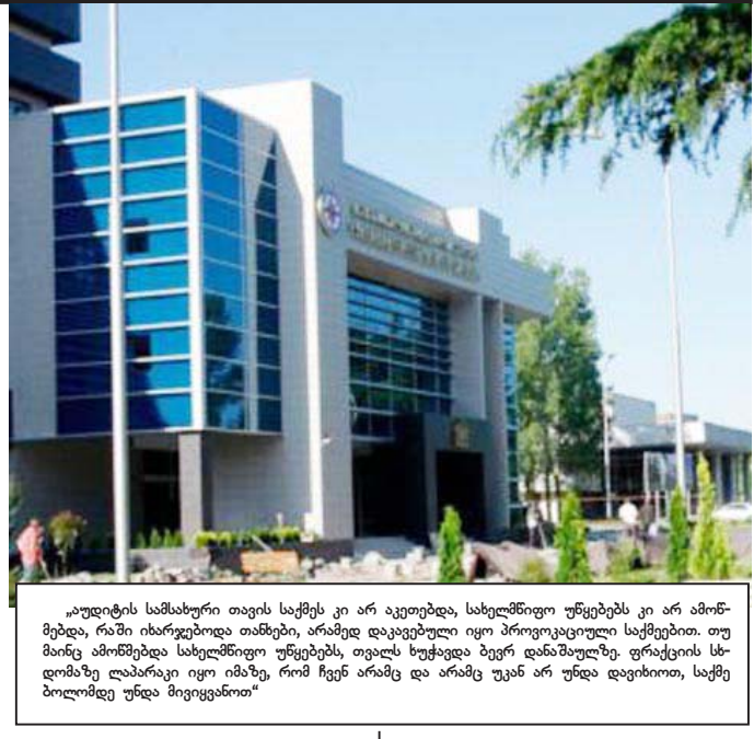
„აუდიტის სამსახური თავის საქმეს კი არ აკეთებდა, სახელმწიფო უწყებებს კი არ ამონებდა, რაში იხარჯებოდა თანხები, არამედ დაკავებული იყო პროვოკაციული საქმეებით. თუ მაინც ამონებდა სახელმწიფო უწყებებს, თვალს ხუჭავდა ბეერ დანაშაულზე. ფრაქციის სხდომაზე ლაპარაკი იყო იმაზე, რომ ჩვენ არამც და არამც უკან არ უნდა დავიხიოთ, საქმე ბოლომდე უნდა მივიყვანოთ“