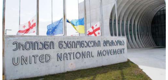
„ნაცმოძრაობის“ მთავარ ოფისში დიდი გლოვია გამოცხადებული. მალე, ალბათ, ოფისის თავზე დროშას დაუშვებენ და მკლავზე შავ სამკლავურებს გაიკეთებენ. მთავარი პროკურატურის მიერ მიხეილ სააკაშვილის წინააღმდეგ სისხლის სამართლის საქმის აღჭერამ, საბოლოოდ გატეხა წელში, დარწმუნდნენ, რომ ირაკლი ლარიბაშვილის ხელისუფლება მათი პოლიტიკურ-კრიმინალური ბანდის სრულად განადგურებას აპირებს

დაიწყო, ერთხელაც კი არ დაუტყუავს პარტიის რომელიმე ლიდერთან გასაშხვევებლად. ადრე მიმა, ყველა კრიტიკულ მომენტში ხან გიგა ბოკერიას ურეკავდა, ხან სხვას, სკაიპითაც ხშირად ერთვებოდა და აზნევებდა თან-