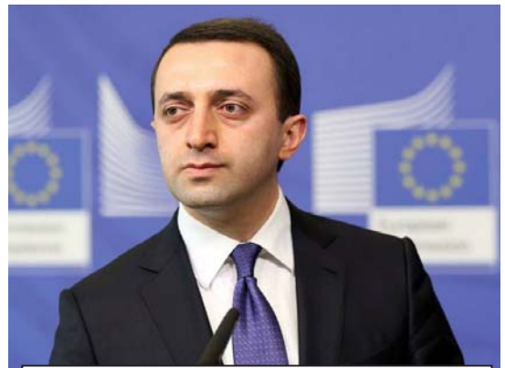
„ვერ პრემიერის მიემართე ოფიციალურად, ხელფასების გაზრ-დის მოთხოვნით და შემდეგ ჩემი პირადი წერილი გამოქვეყნდა პრემიერის მიმართ და, ამას რომ მოჰყვა დიდი გამოსხაურება სოციალურ ქსელებში, საკითხში 5 000 პედაგოგის ჩართვამ შეაშ-ფოთა ეს სახლი“

— აქაც ცრუობს კობახიძე, რად-განაც ჩვენ თავის დროზე მიემართე მაშინდელ მინისტრს გიორგი მარგვე-ლაშვილს, რომ გადაეხსნა ხელ-ფასების ნორმატიული აქტი, ამას მოჰყვა ზეგანაკეთური ხუთლარიანი ანაზღაურება და ის, რომ სერტი-ფიცირებულ პედაგოგებზე რომ არ იძლეოდნენ დანამატს, თუ არ იქნე-ბოდა პედაგოგს 18 საათი, ესეც შე-იცვალა. ამას მაშინაც დაუპირისპირ-და კობახიძე, რომელიც ამბობდა, რომ მე არარეალურად ვფასებდი ბიუჯეტს და არარეალურ თანხებს ვითხოვდი. რაც შეეხება კობახიძის განცხადებას, არსად პედაგოგისთვის თანხის მომატებაც არ წერია, არსად არ არის ეს განერილი და ოფიციალ-ურად არ დევს და მიემართავ მას: სად წერია, რომ ხელფასი 1000 ლარამდე უნდა გაიზარდოს? ისე, ცნობისთვის, ჩვენ 1200 ლარს ვითხ-ობდ და ვიცით, რომ სქემა უნდა ამო-ქმედდეს პედაგოგთა პროფესიული განვითარების და ოფიციალურად აცხადებს სამინისტრო, რომ ამ სქე-მაც იქნება მიმართული პედაგოგების ხელფასი, ვინც გადავა ახალ საფე-რურზე, ვინც გადავა ახალ საფე-რურზე, იმას მოგატყობს ხელფასი. მაგრამ, რამდენი პროცენტით მოე-მატება, რა მიმართებაში იქნება ეს საბაზრო ფასებთან, ამაზე ინფორმა-ცია ოფიციალურად არსად დევს.