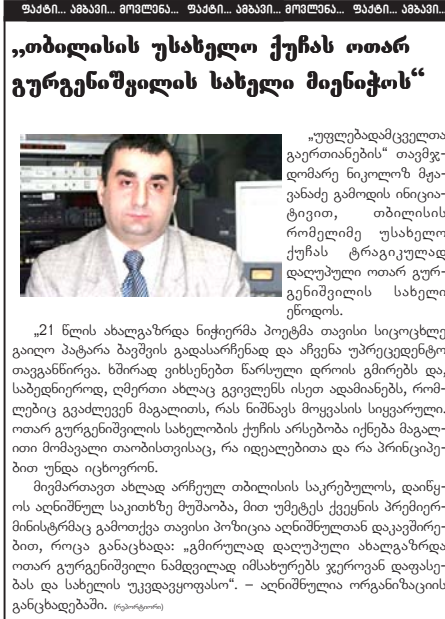
გაგრძელება მე-8 გვერდზე

კილომეტრაჟი და ეს ყველაფერი გაკონტროლდება მკაცრად. ცვეთისა და ბენზინის ხარჯი მაშინ იყო კატასტროფული, როცა საკრებულოს წევრები შაბათ-კვირა ავტობიოგრაფიაზე დასჯილდენენ ოჯახებს, მძღოლებს ბაზარში და სხვა საოჯახო