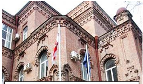
„ჩვენ 1200 ლარს ვითხოვთ და ვიცით, რომ სქემა უნდა ამო-ქმედდეს პედაგოგთა პროფესიული განვითარების და ოფიციალ-ურად აცხადებს სამინისტრო, რომ ამ სქემაც იქნება მიმართული პედაგოგების ხელფასი, ვინც გადავა ახალ საფეხურზე, იმას მოე-მატება ხელფასი. მაგრამ თუ რამდენი პროცენტით მოემატება, რა მიმართებაში იქნება ეს საბაზრო ფასებთან, ამაზე ინფორმა-ცია ოფიციალურად არსად დევს“