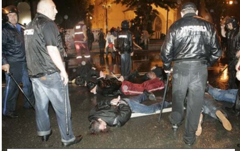
„გამოსულია 100 ათასი კაცი და 20 ათასი პოლიციელი თუ ჯინსიანი „ზონდერი“ ურტყამს. ხომ ვიკითხავ, ამ პოლიციელებიდან თუ „ზონდერებიდან“ რამდენი გყავთ დაჭერილი? ა, არც ერთი? მაშინ ეს საქმე პოლიტიკურია. ბიჭო, რასაც აკეთებ, ბარემ წესიერად გააკეთე და მარტილი მოაყარე“

მაც აქვს უამრავ საბოტაჟს ადგილი. ცოტა ხნის წინ ირაკლი ლარიაშვილმა ამის შესახებ გააკეთა განცხადება, გამგებს უნდა გაეგო, მაგრამ შედეგი მაინც არ ჩანს. თუ შესაბამისი საკადრო პოლიტიკა არ გატარდა, არაფერი არ გამოვა, მე რომ ევროპელი მოსამართლე ვარ და ვუყურებ, სააკაშვილს ბრალდებებს უყენებ, იქ ეს ადამიანი დარბოდა და „დუბინკას“ იქნედა? ერთი კადრები მანახეთ... ვააა, ვნახე, გამოსულია 100 ათასი კაცი და 20 ათასი პოლიციელი თუ ჯინსიანი „ზონდერი“ ურტყამს. ხომ ვიკითხავ, ამ პოლ-